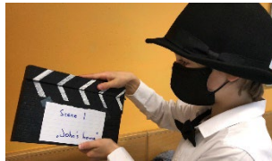
„Parrot learns a lesson“