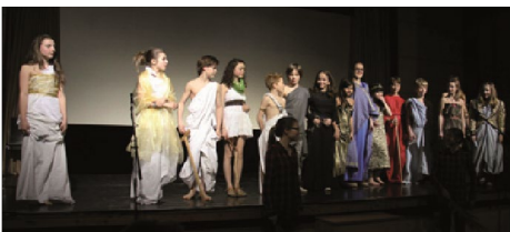
„Nachts im Museum“